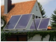
Freiaufstellung 45° vertikal