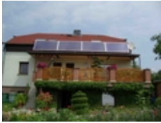
Freiaufstellung 45° horizontal